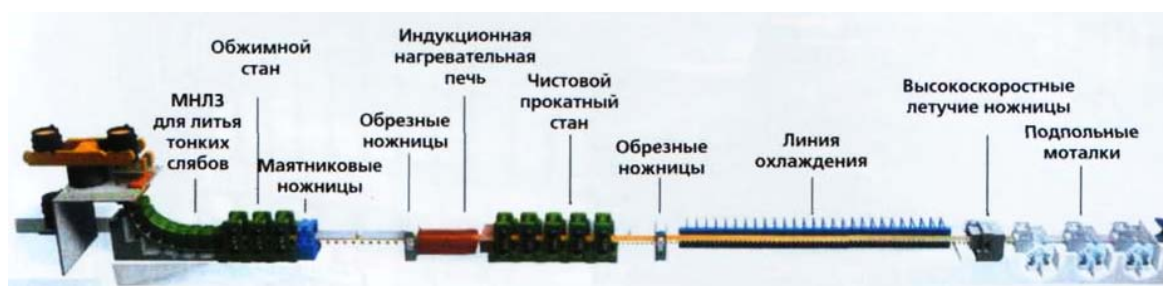
Рисунок 1 – Технологическая схема производства проката на литейно-прокатном модуле

Прокатная часть ЛПМ может быть совмещена с одной или двумя МНЛЗ в зависимости от номинальной производительности цеха (рисунок 1). По сути ЛПМ представляет собой хорошо гармонизированную и автоматизированную систему, состоящую из тонкослябовой МНЛЗ, участка подогрева (выравнивания температуры) сляба и очистки его от окалины, и прокатного стана для получения горячекатаного листа заданной толщины.