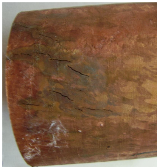
Рисунок 3 – Продольные межкристаллитные трещины на поверхности экспериментальной трубной заготовки

В результате визуального осмотра образцов на части из них обнаружены продольные поверхностные межкристаллитные трещины (рисунок 3). Наличие дефектов на поверхности литой заготовки свидетельствует о том, что в процессе кристаллизации и последующего охлаждения отливки в ней образовывались значительные термические напряжения, превышающие прочность металла при высоких температурах (близких к температуре начала кристаллизации расплава).