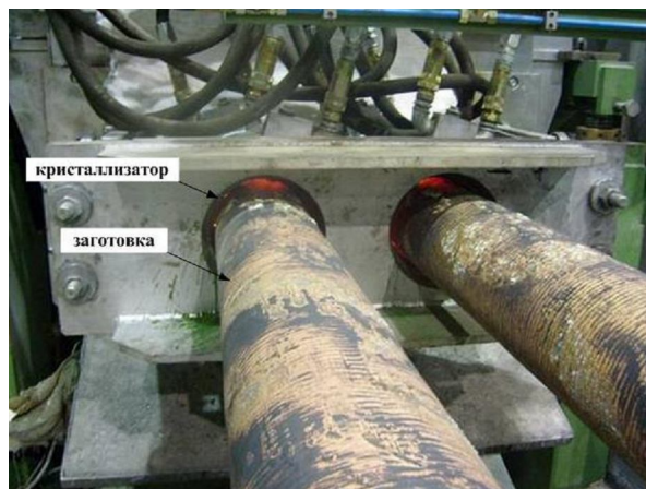
Рисунок 1 – Отливка круглых заготовок на установке горизонтального непрерывного литья

Как было отмечено выше в настоящее время определенный сектор рынка медной металлопродукции занимают трубы, заготовки, для которых могут производиться с использованием УГНЛ (рисунок 1). При этом имеется возможность сочетать невысокую стоимость и производительность установки с более высоким качеством получаемых заготовок по неметаллическим включениям и газовой пористости. Кроме того, легче решается вопрос организации непрерывной порезки металла и обслуживания технологического оборудования.