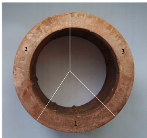
1 – мелкозернистая структура; 2, 3 – крупнозернистая структура

Исследование поперечных макрошлифов показало, что все образцы, отобранные в процессе эксперимента, не смотря на различия в химическом составе и технологических режимах разливки, характеризуются идентичной структурой (рисунок 2). Сектор трубы с углом примерно 60 градусов, примыкающий к нижней части графитовой втулки кристаллизатора (рисунок 2, участок 1) имеет мелкозернистую структуру с размером отдельных зерен 0,5-1,5 мм, остальной сектор литой трубы отличается крупнозернистой структурой с размером отдельных зерен 1,5-5,0 мм.